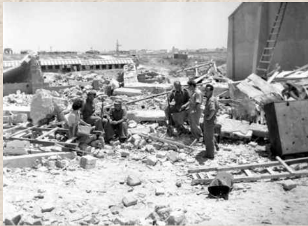
הריסות היישוב ניצנים