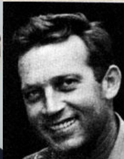
אלוף משנה אריק רגב ז"ל