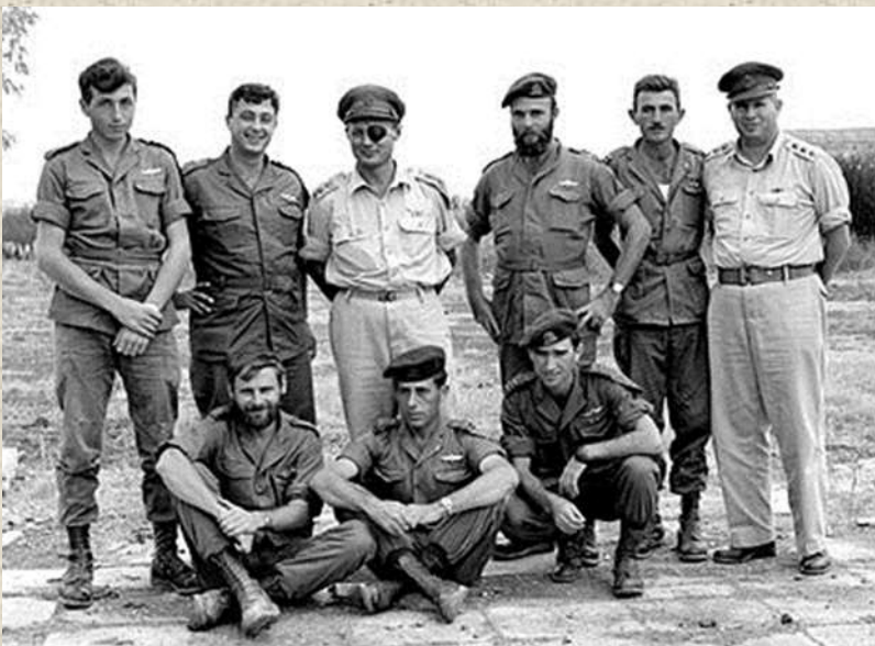
לוחמים מיחידה 101 לאחר פעולת תגמול בכונתילה.

למרות שהזמן בו יחידה 101 פעלה בצורה עצמאית היה קצר, אין ספק שהיא השאירה חותם אדיר, היחידה כתבה למעשה את ערכי צה"ל בכל הקשור לרעות, חתירה למגע ודבקות במשימה והפכה לאחד מסמלי המורשת הגדולים ביותר בתולדות צה"ל.