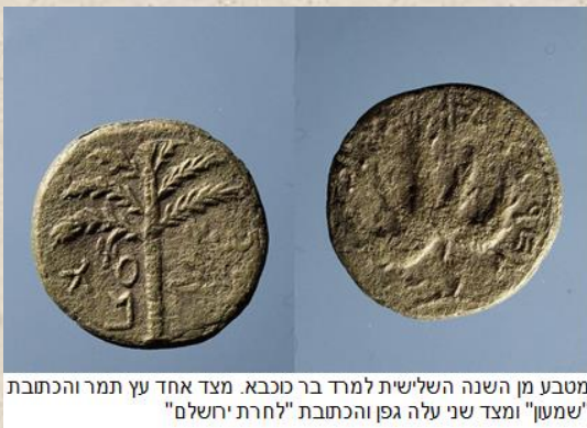
מטבע מן השנה השלישית למרד בר כוכבא. מצד אחד עץ תמר והכתבת "שמעון" ומצד שני עלה גפן והכתבת "לחרת יחשלם"

נחזור לחורבת צלית: מבנה החצר חרב בשריפה גדולה, עדות לכיבוש המקום בסופו של מרד בר כוכבא. בפינת אחד החדרים התגלה שקיק בד ובו מטמון מטבעות כסף מימי הקיסרים אספסיאנוס ועד הדריאנוס. מטמון נוסף בן 22 מטבעות ברונזה נמצא מדרום למצודה. אלו הם מטבעות ברונזה מן השנים הראשונה, השנייה והשלישית למרד בר