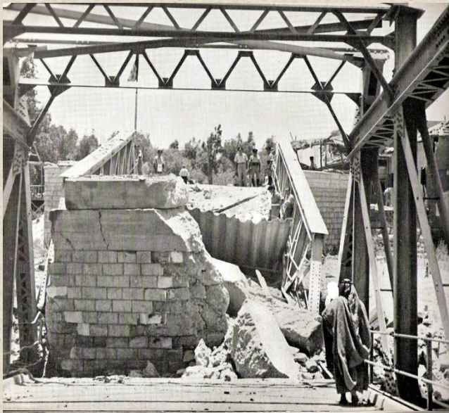
גשר אלנבי לאחר שפוצץ

אין ספק כי פעולת ליל הגשרים החישה את סיום המנדט הבריטי בארץ ישראל ובכך קידמה את רעיון המדינה שבדרך.