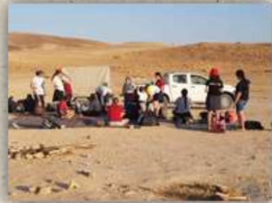
מסע נודד בנות תשע"ט