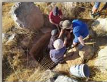
קייטנת סיורים בנים תשע"ט