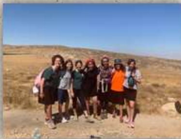
קייטנת סיירות בנות תשע"ט

בכל שאלה - מוזמנים להיכנס לאתר http://www.susya.org.il או להתקשר למשרד 02-9961.148