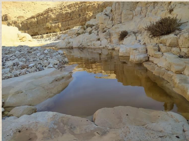
גבים בנחל צאלים לאחר שיטפון.

ולסיום נחזור לדוד ומזמוריו. בפרק כג בתהילים נוכל לקרוא את תיאורו של דוד לימים שבאים לאחר ששטפו המים בנחלי המדבר- ב בְּנָאוֹת דָּשָׁא, יִרְבִּיצְנִי; על-מי מְנַחֹת יְנַהֲלִנִי. בפסוק זה בא לידי ביטוי הנחת הבאה אל המדבר לאחר השאון הרב. המים שנותרו עוד זורמים מעט בזרזיפים, מתוך האדמה הרוויה כעת במים מתחילים לנבוט שלל זרעים שחיכו רבות למים האלה שיגיעו והנה לנו נאות הדשא ומי המנוחות שבאו לאחר השאון הרב של השטפון.