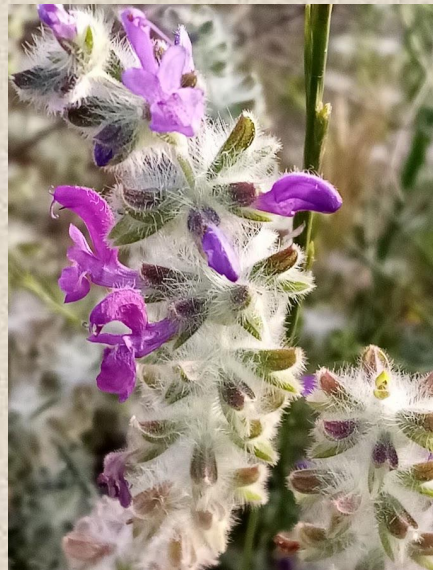
מרווה צמירה- הפרח מדמה קורי עכביש!?