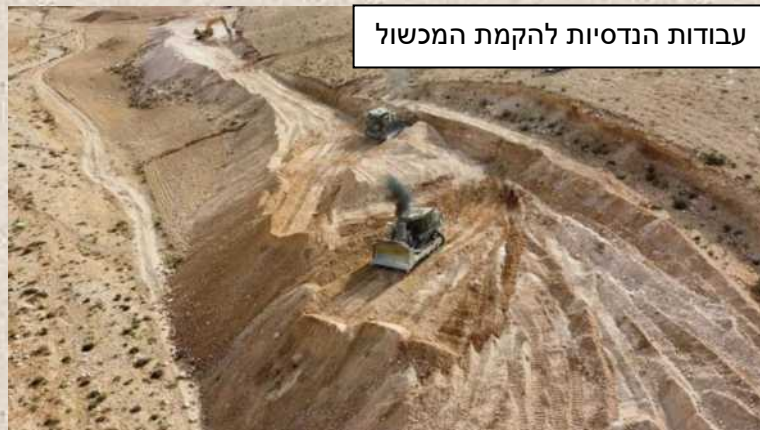
עבודות הנדסיות להקמת המכשול