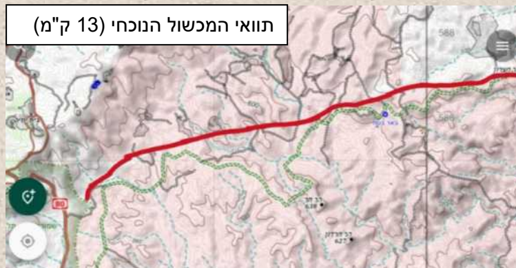
תוואי המכשול הנוכחי (13 ק"מ)