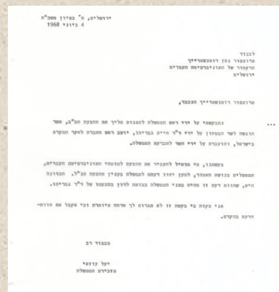
התייעצות מזכירת הממשלה עם רקטור האוניברסיטה העברית