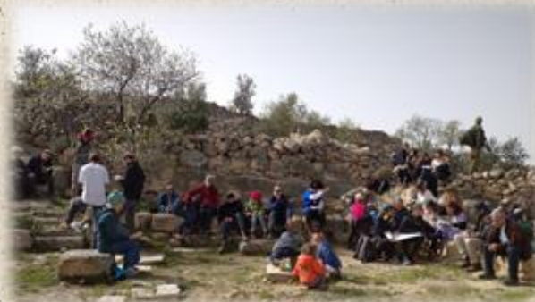
קריאת מגילה בתל מעון