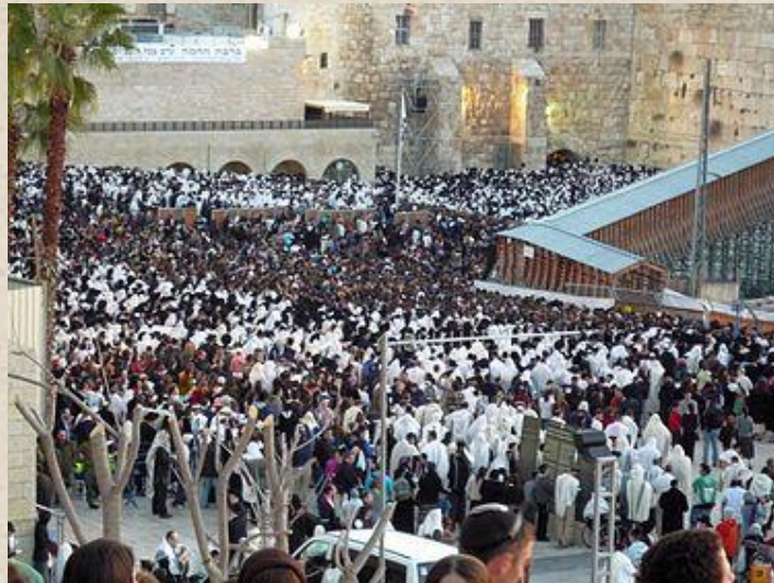
ברכת החמה בכותל בשנת 2009 תשס"ט

וְנִקִּיתִי מִפֶּשַׁע רָב. טו וְהָיוּ לְרִצּוֹן אִמְרֵי פִי וְהִגִּינוּ לִבִּי לִפְנֵיךָ: ה' צוּרִי וְגֹאֲלִי.